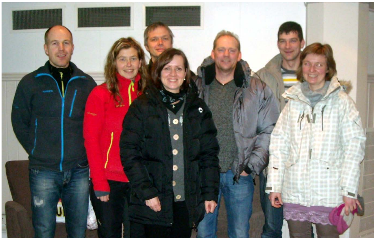
Styret i Leknes Skiklubb 2011

Styret har avholdt 6 styremøter i løpet av året. Styret ønsker å rette en spesiell takk til alle som har bidratt til vår virksomhet i 2011.