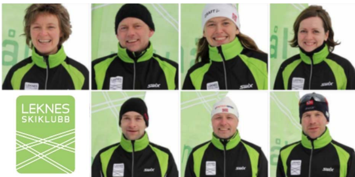
Styret i Leknes Skiklubb 2014

Styret har avholdt 6 styremøter i løpet av året. Styret retter en takk til alle som har bidratt til klubbens drift.