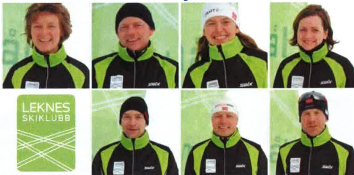
Styret i Leknes Skiklubb 2015

Styret har avholdt 6 styremøter i løpet av året. Styret vil takke alle som har bidratt til klubbens drift.