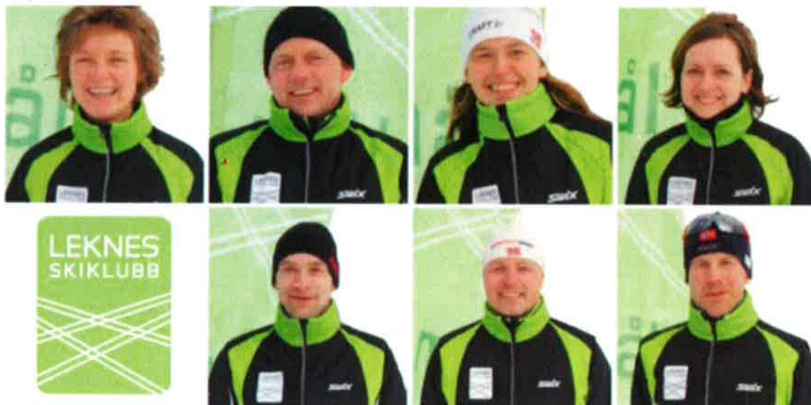
Styret i Leknes Skiklubb 2016

Styret har avholdt 6 styremøter i løpet av året. Styret vil takke alle som har bidratt til klubbens drift.