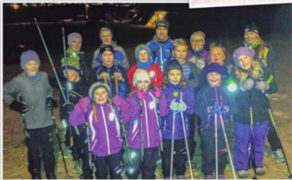
HELE GJENGEN: Denne flotte gjengen møtte til årets første skitrening med Leknes skiklubb.

Treningene til Leknes skiklubb er for alle i alderen åtte år og eldre. De fleste som kommer er mellom åtte og fjorten år, men også eldre ungdommer